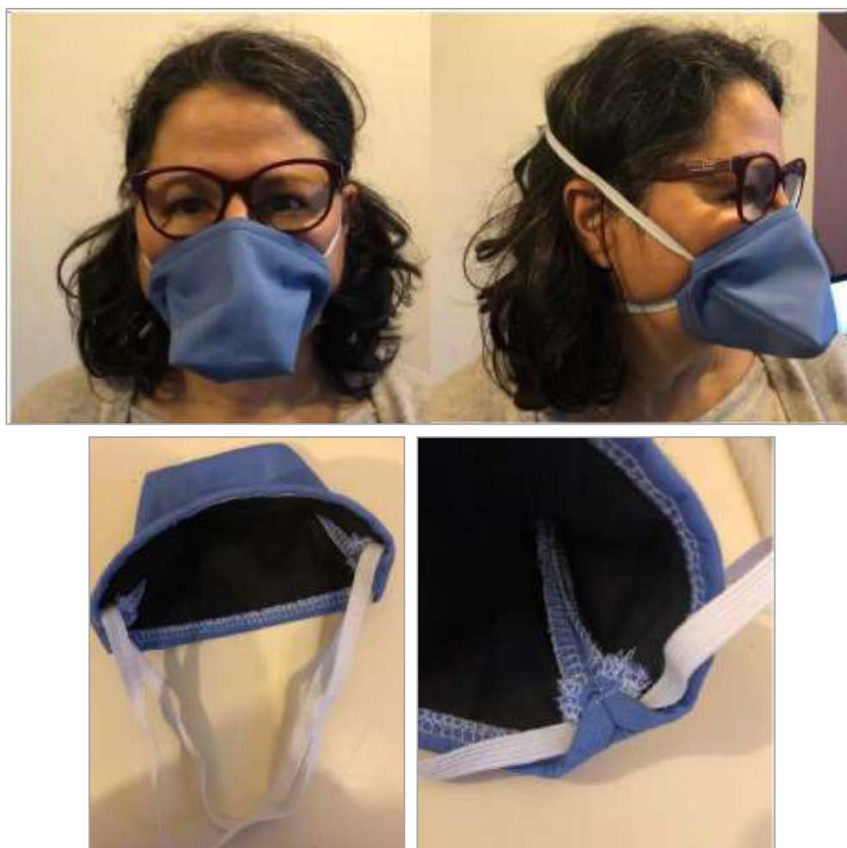
Figure 6 — Exemple de masque barrière de type « Bec de canard »