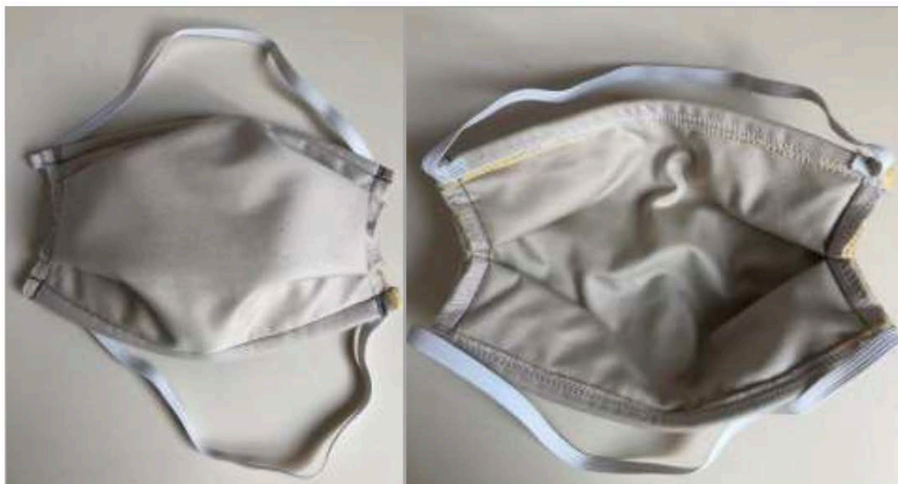
Figure 9 — Exemple de masque barrière « à plis »